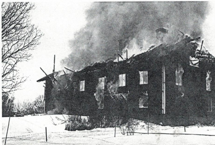
Nu har taket rasat i