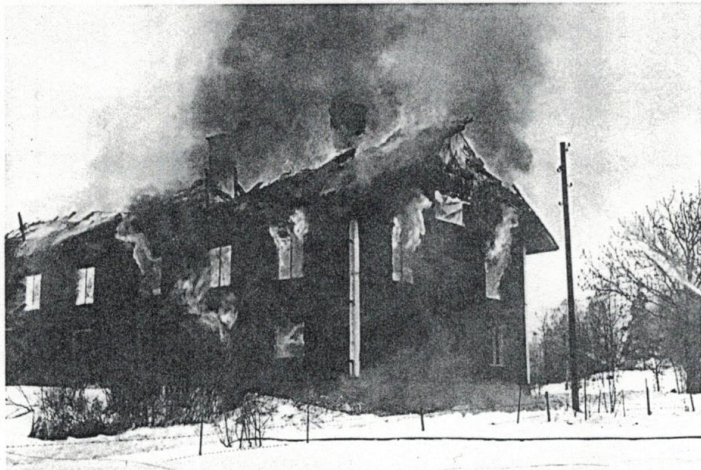
En murstock har fallit.