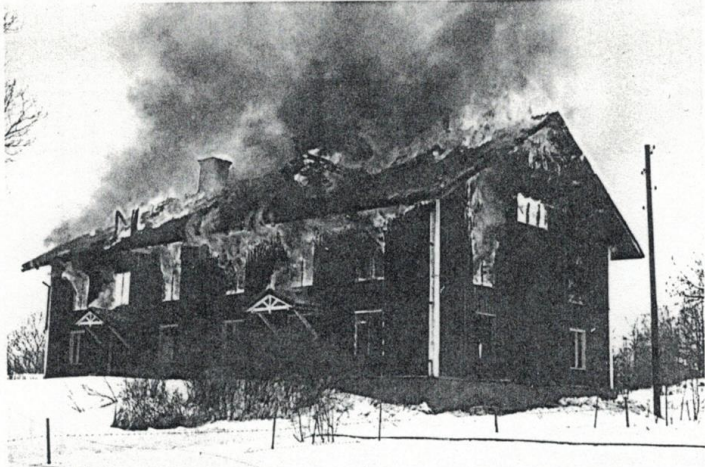
Gammalt hus men ändå med vemod.