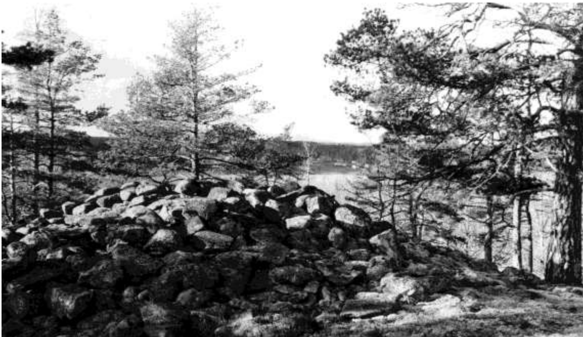
Gravröse mellan Hartorpegöl och Hummelstad gård.