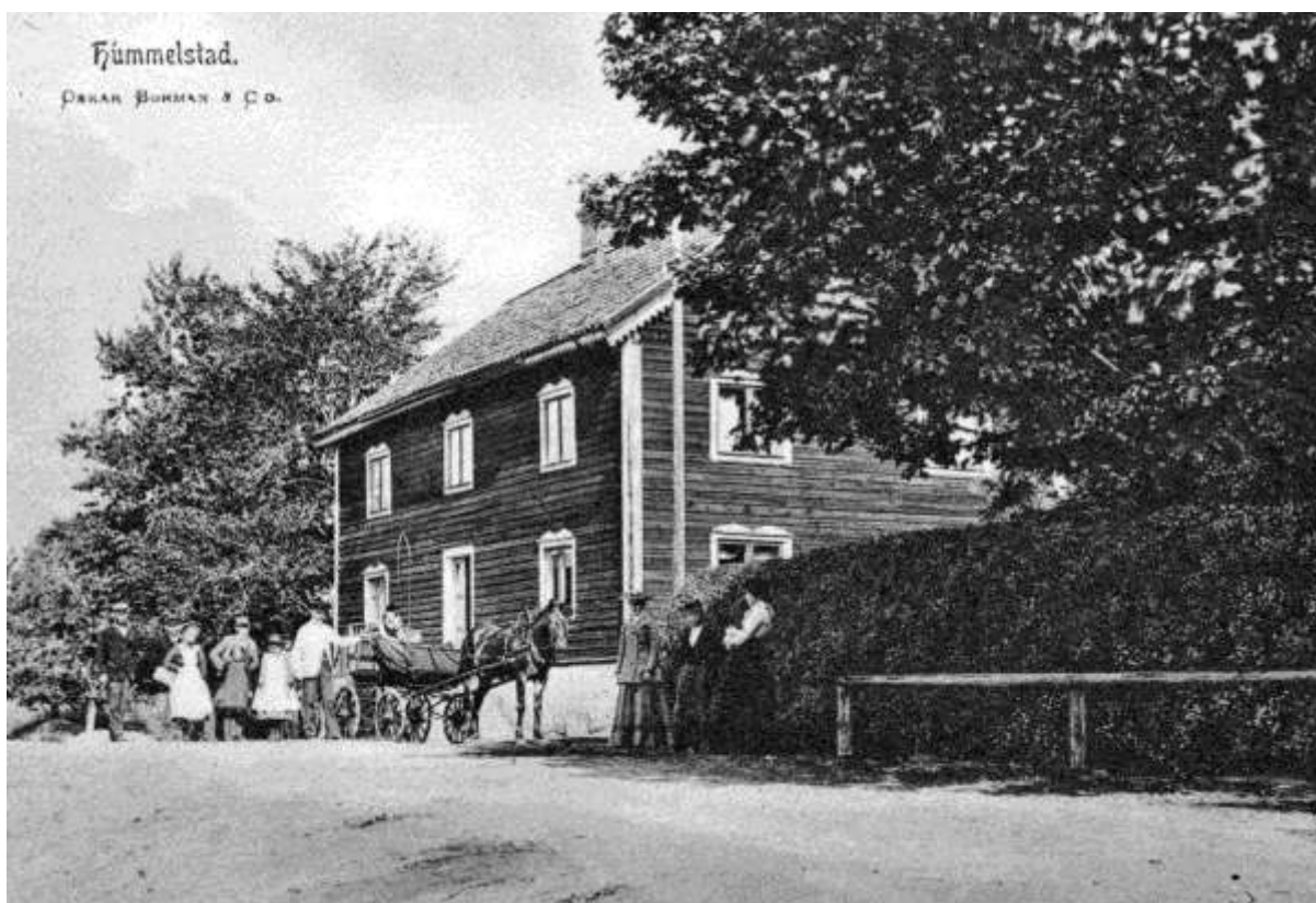
Krogen i Hummelstad.