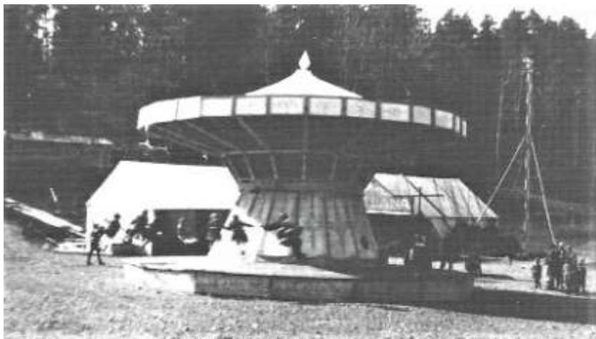
Ambulerande tivoli gästade under 1930-talet ofta Frösvi festplats.

I dag har alltså alla fester och all fotboll upphört på Frösvi. Det som började som Bollklubben Falken har på sätt och vis fortsatt, även om det nu är fyrbenta vänner som med sina ryttare intagit området. Och detta genom att Ryttarsällskapet Falken flyttat in och på den plats där fotbollsplanen låg nu byggt en paddock och ridanläggning på området.